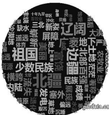
图 1 “内蒙古”前置修饰成分词汇云图

从词汇云图看,大多前置修饰成分主要集中在建构内蒙古辽阔的边疆少数民族地区形象。对这些前置修饰成分意义进一步分类得到表 2 。