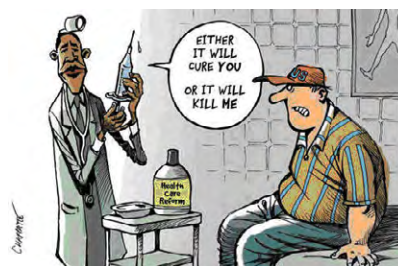
图4 Hospital scenario metaphor( Thzsimmery , http://politicalhumor.about.com/lr/editorial_cartoons , retrieved August 2012)

就富人阶层(1%)、政府补贴工业、跨国公司和军工企业。这种解释需要读者进行范畴解读:通过选取“给超过婴儿期的孩子哺乳的母亲”为源域,漫画表明美国联邦政府也应该归入“溺爱孩子”的范畴。