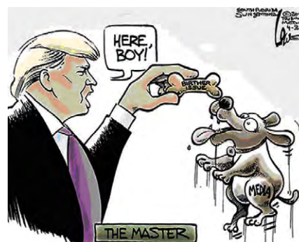
图 5 ( http://politicalhumor.about.com/lr/editorial_cartoons , retrieved October 2012)

nald Trump)把一块骨头丢给右边一只垂涎欲滴的狗,根据狗身上的文字 media 可以识别第一个隐喻——媒体是狗,根据递给狗的骨头上标示的文字 birther issue 可以识别第二个隐喻——奥巴马的出生地问题是骨头。显然,这里主人给狗扔骨头的图式只能帮助读者了解一个公众皆知的事实,即唐纳德·特朗普把奥巴马的出生地问题抛给媒体去做文章,读者要了解漫画所要表达的观点就必须作深一层的解读。我们认为,这层解读依赖于对源域狗的范畴解读。范畴解读依据的是诊断性原则,即狗与其他动物的区别关系而不是狗与脚本中其他人物事件的区别关系。狗的祖先是原始人类的近邻,以人类的剩余食物和排泄物为生,这决定狗具备对人的依附以及随之而来对人的百依百顺、惟命是从等范畴特点。在此例中,具有高诊断值的狗的类属或范畴特征是嗅觉灵敏、忠实听话、惟命是从。因此,不难判断漫画旨在讽刺媒体甘当特朗普的忠实走狗。