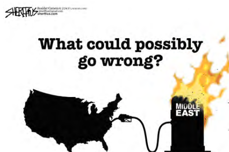
图 1 ( Sherflus, http://www.cartoonstock.com , retrieved August 2012)

(2) 指出对社论漫画的解读还须要增加一个步骤和维度; (3) 对漫画传递的批判观点进行解读。